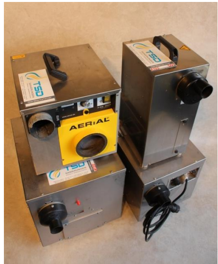
Adsorptionstrockner versch. Größen