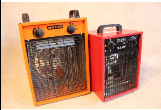
9 kW und 3 kW