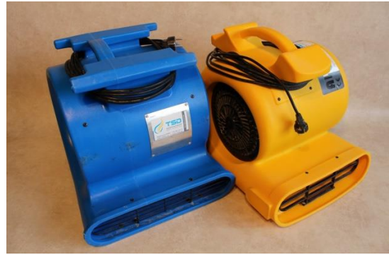
Turbogebläse blau und gelb