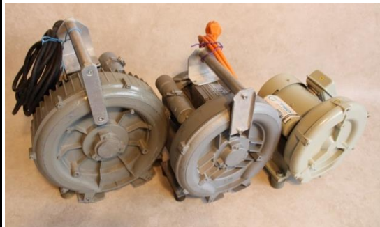
klein und groß