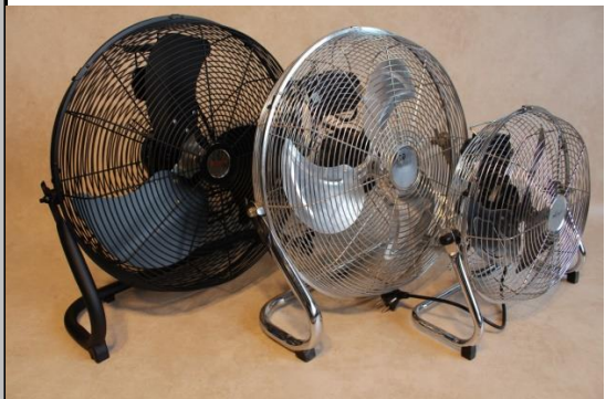
Ventilatoren klein und groß